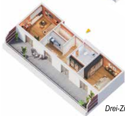
Drei-Zimmer-Apartment (67 m 2 )